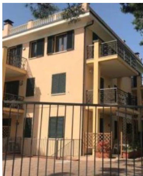
Alloggio all'asta nella villa in via Bellavista a Bordighera

Foto, prezzi e informazioni di tutte le vendite giudiziarie. Tantissimi posti auto e garage tra Castellaro e Bordighera. Ecco come partecipare agli incanti telematici del Tribunale.