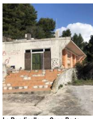
La Rondinella su Capo Berta

SANREMO Nel primo Festival dell'era Covid la città si adegua alle nuove restrizioni. «Abbiamo dato la possibilità ai ristoranti della città, distanti non più di 700 metri dal Teatro Ariston e dal Casinò, di rimanere aperti come servizio-mensa per dipendenti Rai - ha dichiarato Andrea Di Baldassare, presidente Confcommercio». «Siamo anche disponibili per il servizio delivery negli alberghi o nelle case affittate dagli artisti» spiegano i ristoratori. Sono oltre 25 i pubblici esercizi